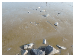
瀉花 (干潟の褐色の部分)