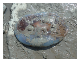
ビゼンクラゲの死骸